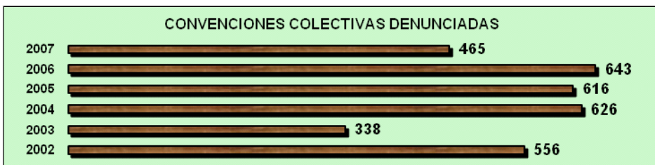
GRÁFICO 2 DENUNCIAS DE CONVENCIONES COLECTIVAS, 2002-2007

El Ministerio presenta las siguientes estadísticas: